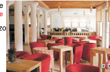
Restaurant / Bar

Pilates - und Wohlfühlwoche Hotel Kronblick *** Hurtmühle Stefansdorf | S.Stefano, 1 I 39030 ST.LORENZEN | S.LORENZO Südtirol Tel. 0039 0474 548300 www.hurtmuehle.com